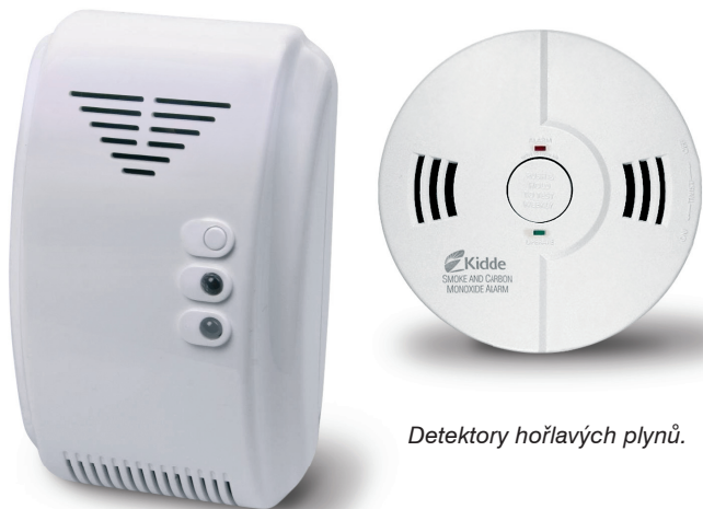
Detektory hořlavých plynů.