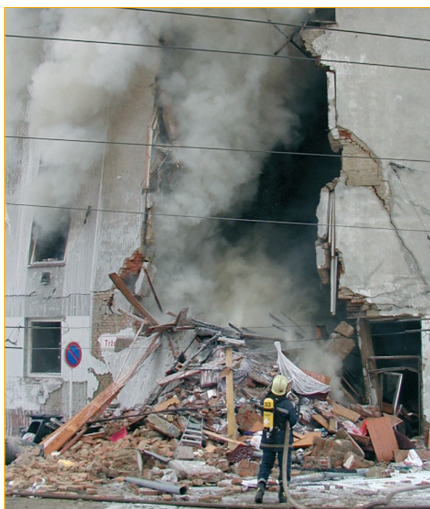
Výbuch plynu v Brně na ulici Tržní.