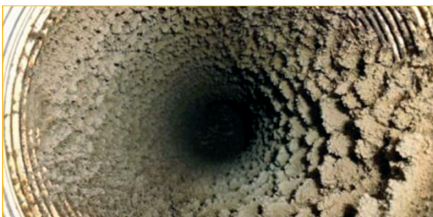
Zanesená komínová vložka pro spotřebič na zemní plyn.

Tato povinnost se dle současně platných právních předpisů netýká občanů (fyzických osob). Tyto osoby jsou povinny instalovat tato zařízení v souladu s pravidly pro užívání a technickými návody pro instalaci. Dále jsou povinny udržovat plynová zařízení v takovém stavu, aby nedošlo k ohrožení života, zdraví či majetku a v případě zjištění závady tuto neprodleně odstranit.